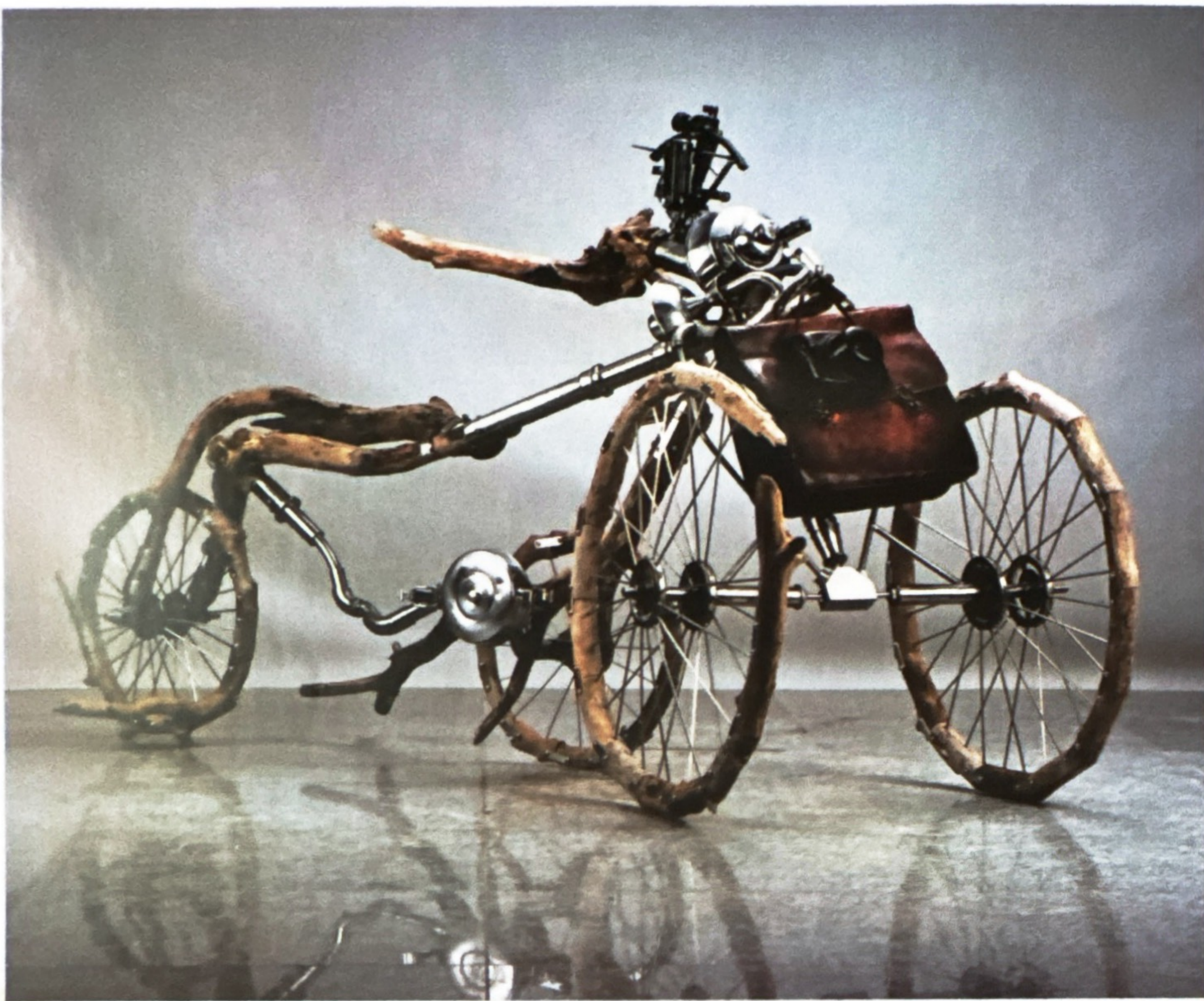
김광우 · 〈P22-우체부〉 나무, 스테인리스 스틸, 가방, 카메라 200×66×95cm 아래 · 최승호 〈침묵의 마을〉 브론즈 130×95×100cm 1991