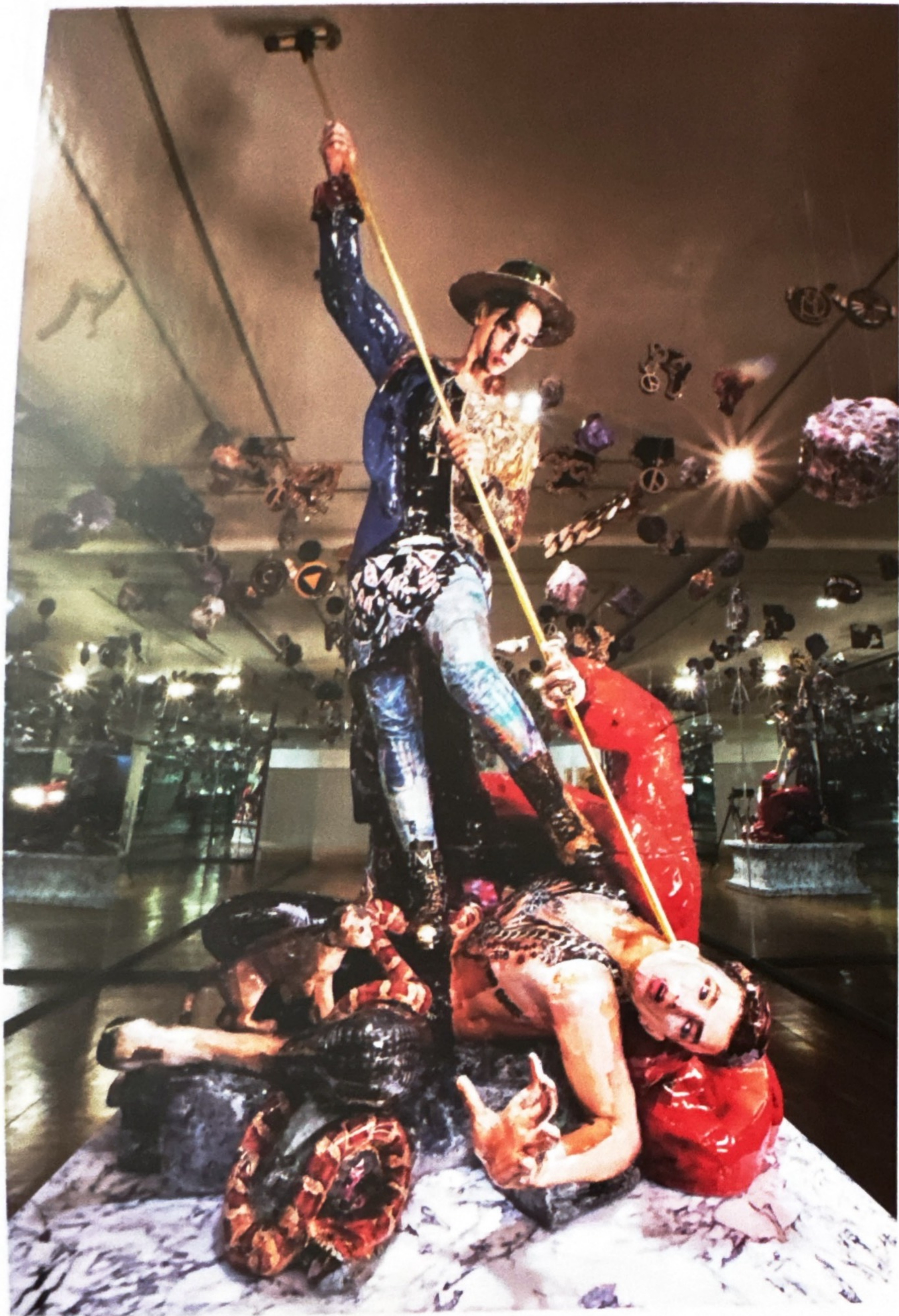
왼쪽 · 권오상 《무제의 지드래곤》 컬러 유리블 외 혼합재료 176×105×300cm 2015 오른쪽 · 박재영 《Downier! New Product》 혼합재료 2011