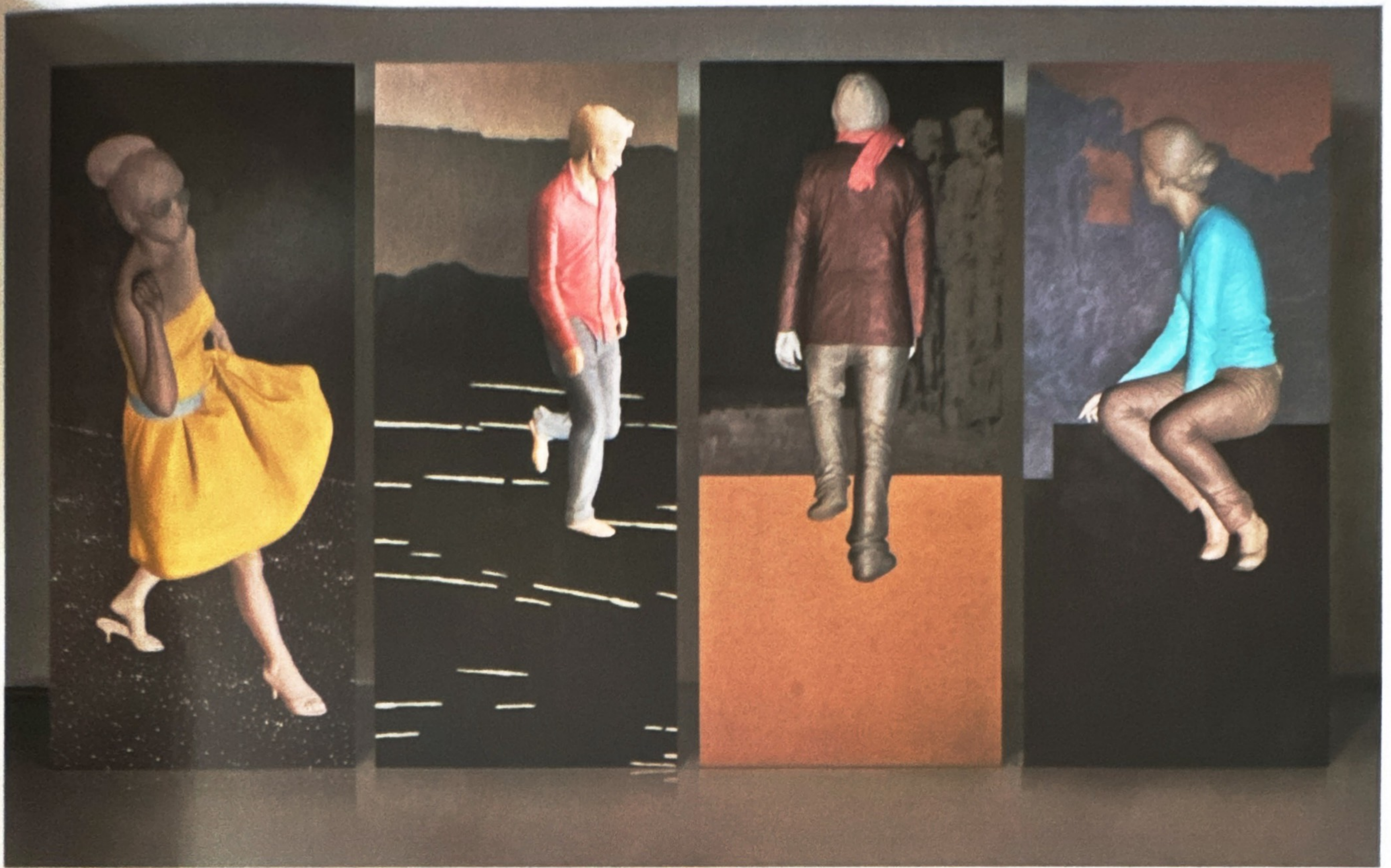
위 · 이용덕 <Synchronicity> 420×235×30cm 2009 아래 · 임송자 <아이와 엄마> 테라코타 55.5×102.5×10cm 2005